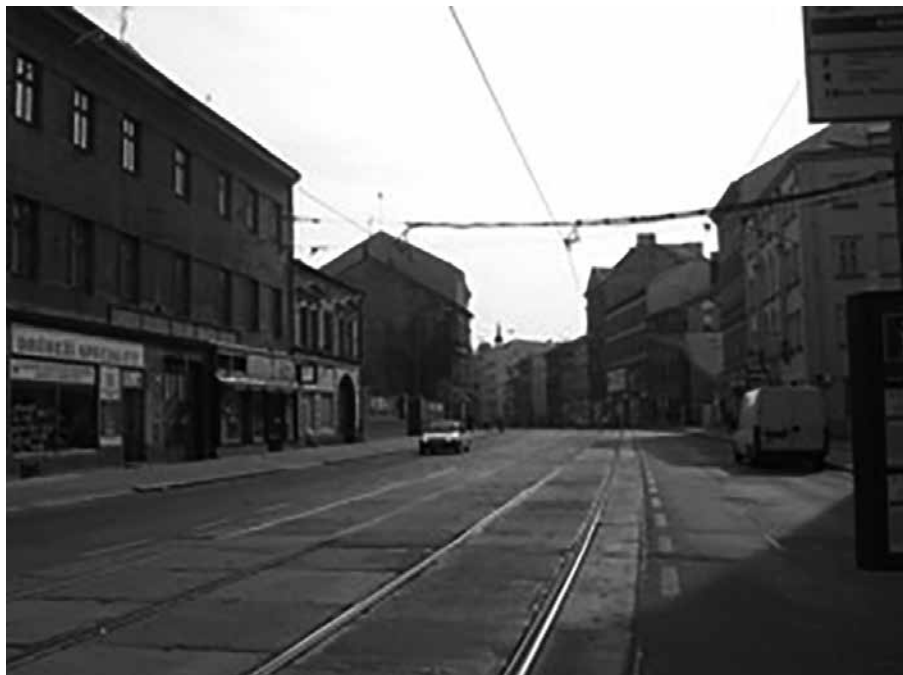
Pohled na ulici Cejl z nároží ulice Körnerova.

Současně v devadesátých letech můžeme zaznamenat první investorské počiny. Stručně zmiňme administrativní centrum IBC, vystavěné v roce 1997, které dnes leží na okraji lokality a slouží jako kanceláře, luxusní ubytovací kapacity, garáže a zázemí pro obchody a kavárny. Co se týká kulturních zařízení, v roce 1999 proběhla rekonstrukce loutkového divadla Radost, které se nachází zhruba v polovině ulice Bratislavská blíže k centru vyloučené oblasti. V roce 2000 získalo sídlo taktéž Muzeum romské kultury (založené v roce 1991), pro které byly upraveny prostory bývalého nájemního domu. Muzeum se nachází v samotném centru oblasti na prostranství, kde se kříží ulice Hvězdová a Bratislavská. Tyto velké pilotní projekty můžeme považovat za první kroky vedoucí k dnešním viditelným změnám lokality.