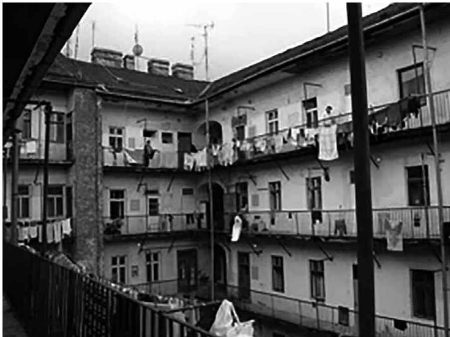
Pohled na pavlače bytového domu na ulici Cejl – stav k roku 2008.

V období těsně po druhé světové válce (31. května 1945) byli následně násilně odsunuti rezidenti německé národnosti, odhad hovoří o přibližně 27 000 obyvatel. Následky holocaustu a poválečného násilného odsunu zanechaly v oblasti citelnou stopu. Sociální stav hraničící s vyloučením přitom v oblasti nevznikl náhle, ale je důsledkem dlouhodobého vývoje sahajícího k událostem druhé světové války. Další příčinou byl postupný úpadek industrializace, což je pro vyloučené oblasti jako takové a jejich historii typickým rysem, a stagnace nízké úrovně bydlení v lokalitě v době komunistického režimu.